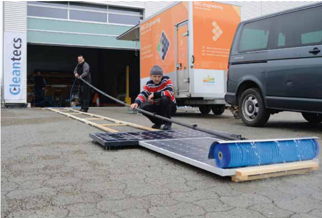
Abbildung 1: Darstellung des Modulreinigungsvorgangs mit Reinigungsgerät C700